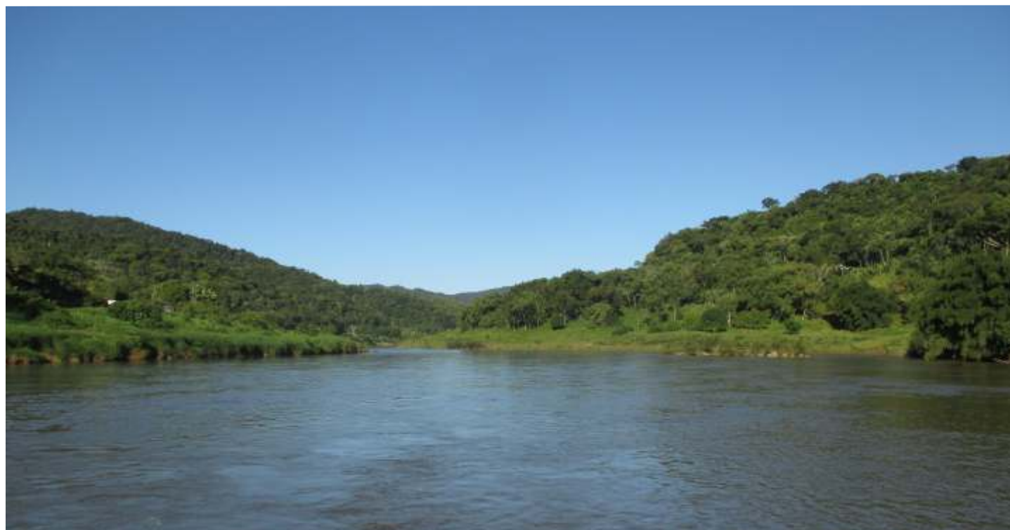
Rio Ribeira de Iguape, Eldorado-SP.