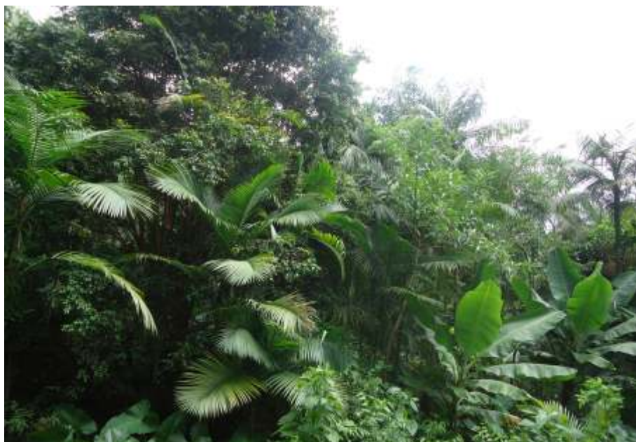
Agrofloresta da família de Sezefredo Gonçalves da Cruz.